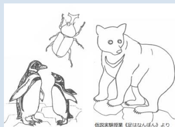
仮説実験授業『足はなんぼん?』より

《申込方法》 往復はがきまたは来館(来館の場合は返信用に「62円」の郵便はがきを持参してください)ホームページからもお申込みができます。