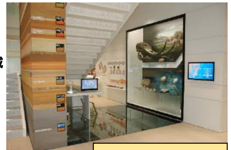
展示室「川崎の大地」

☆「ステラドームスクール」を活用した学習投影を行う場合は、1校のみでの学習投影となります。「ステラドームスクール」を活用した学習投影をご希望される場合は、予約申し込み時に館職員とご相談ください。