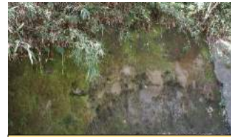
観察ポイント1「飯室泥岩層」