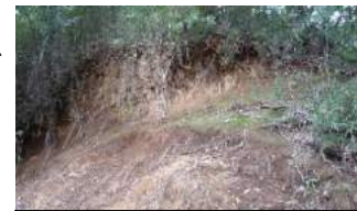
観察ポイント3「多摩ローム」